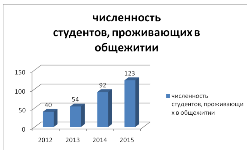
Рисунок 1. Динамика численности студентов, проживающих в общежитии в 2012-2015 г.г.

В общежитии КГАУ «Управление общежитиями Пермского края» проживают 123 студента. Численность проживающих из сельской местности ежегодно увеличивается.